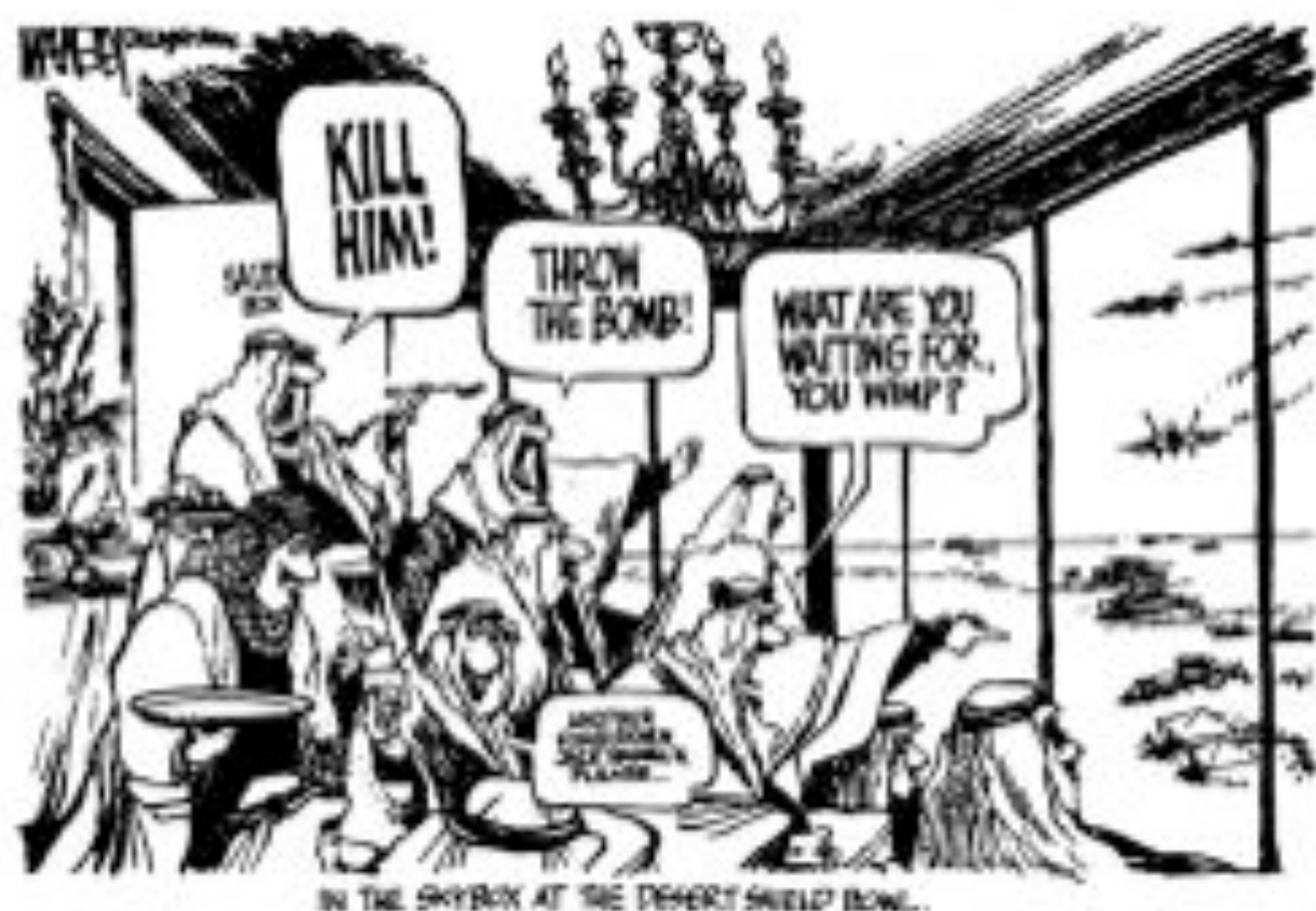
« Dans la tribune d'honneur de Superbowl... (Illustration de W. V. Dillingham, 1968) »

situation tout d'abord en vue de la situation dans les semaines précédant les affrontements entre militaires jordaniens et palestiniens :